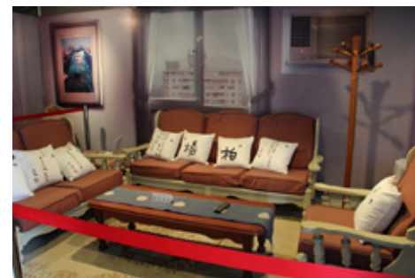
台南大學柏楊紀念文物館一景

他提到自己過去拜拜，但是怒氣一來，照樣發脾氣，應酬也多，照樣大碗乾杯，直到成為基督徒，生命才有了改變，並且逐漸的成熟。體會基督徒有真神能「交託重擔」，真是寶貴。其次，在上帝及真理的餵養下，心變得柔軟，從教會弟兄姊妹對他的包容及付出，看