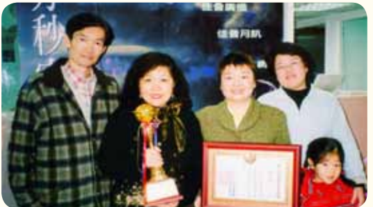
群策群力，屢次獲獎受肯定