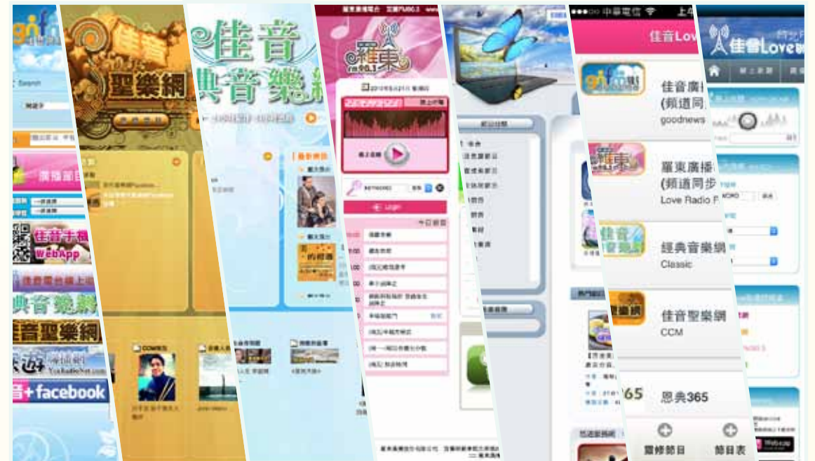
佳音Love聯播網站具備各種服務功能

佳音電台成立20年了，資訊組期許抓緊科技的潮流走入社會，繼續使用新科技、好工具，傳好佳音、報好福音。■