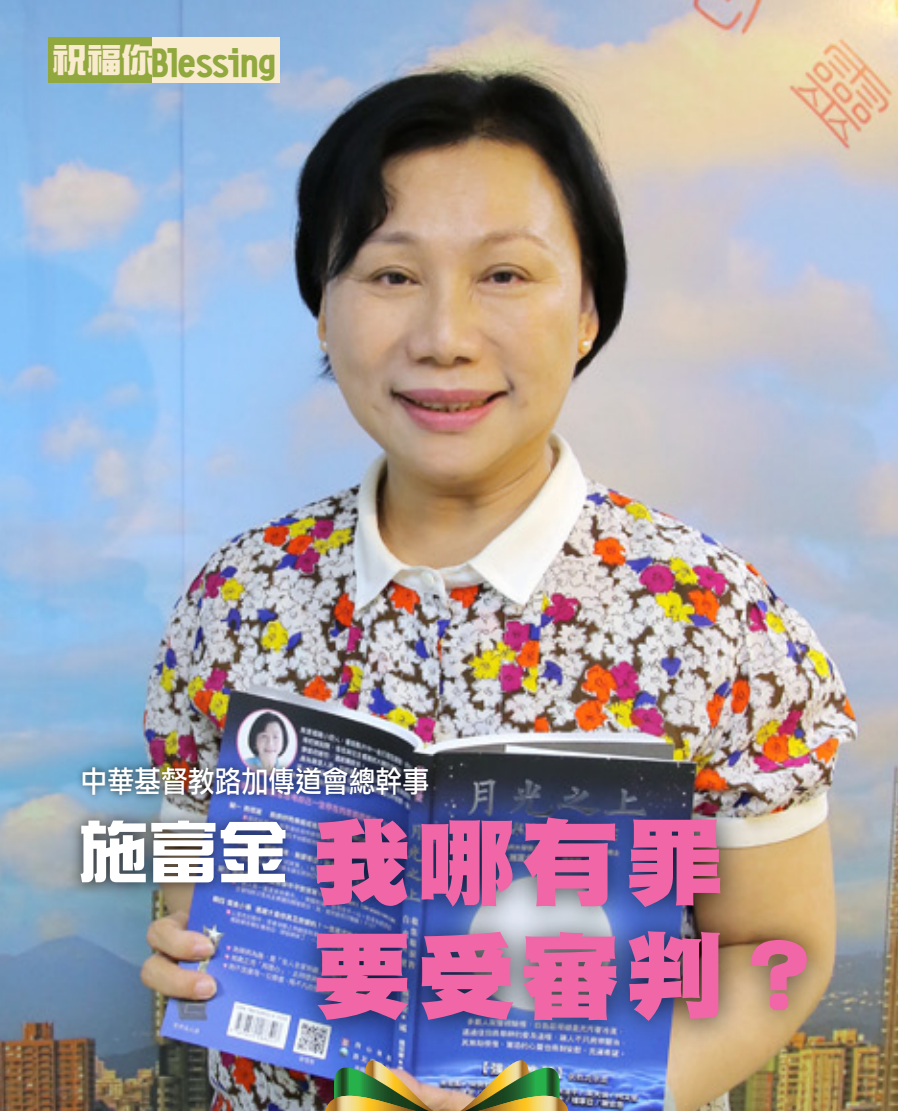
中華基督教路加傳道會總幹事