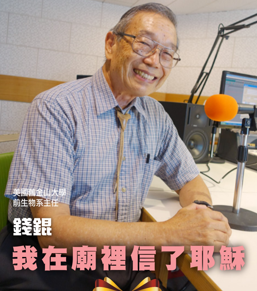
美國舊金山大學前生物系主任