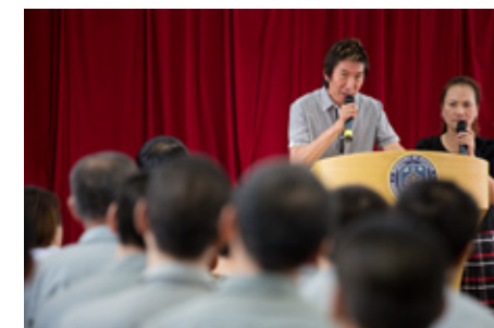
常到監獄所向受刑人見證

耶穌對他說：「你知道地獄是怎麼回事，你都無法忍受，你帶領的黑道朋友受得了嗎？你要講義氣，就去建立教會帶領黑道朋友信耶穌，讓他們能進天國……。」他順服去做，不但進神學院讀書，並與教會牧師在香港成立「得勝崇拜教會」，已經有不少黑社會人士及家屬信耶穌。接下來將陸續在各國的重要城市建立適合黑社會聚會的教會，用合適的言語和方式向他們傳福音，幫助他們認識耶穌的救恩，成為上帝的兒女。