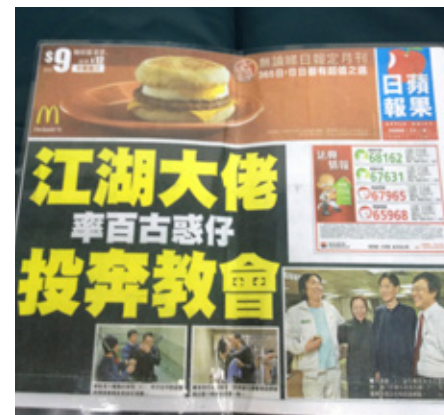
信主的消息各大報頭版皆報導

寫好遺書、安排後事，突然清楚的聽到耶穌說話：「你要死是不是，那你就快點去死啊！你死之後，你的大兒子要砍死他們…」他知道這是真的。自從離開元配與小太太住，大兒子就氣憤的