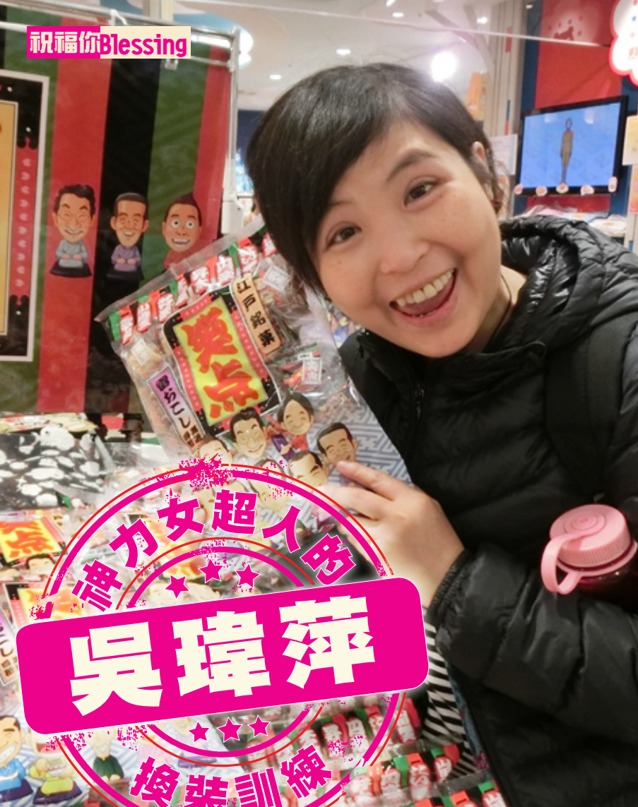
本欄供教會、醫院等團體使用